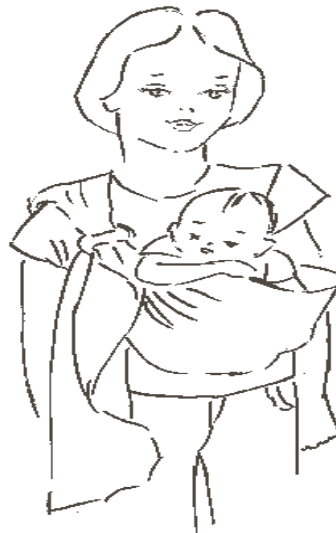
Sentada de frente